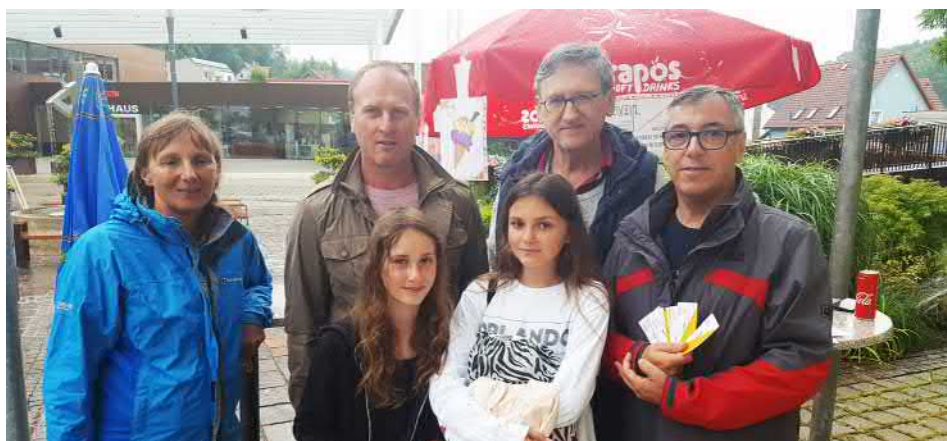
Die Gemeinderätinnen und Gemeinderäte der OBL verteilen Eisgutscheine

scheinstand ein, um mit den Gemeinderäten der OBL Fraktion zu plaudern und sich über das Geschehen in der Gemeindestube zu informieren – eine AKTION, die im nächsten Jahr sicherlich wiederholt wird. ■